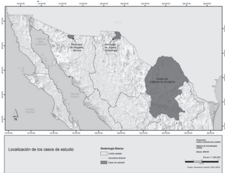
Mapa 1. Localización de casos de estudio