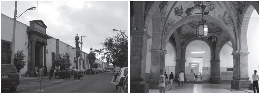
Fachada e interior del hospital. Se puede ver parte de la pintura mural “El benefactor” de Gabriel Flores (fotografías: Beatriz Núñez, septiembre de 2003).

La ubicación de cada una de las salas de enfermos —22 salas y 16 piezas, según el plano de 1792— (Oliver, 1992: 253-254) y demás dependencias —capilla, templo, baños, botica, almacenes, refectorio, celdas para los religiosos, patios, lavanderías, caballerizas, huerta, corrales, campo-santo, etc.— 6 siguió una disposición funcional pero también jerárquica, apreciable hasta en los nombres otorgados a las salas de los enfermos —nomenclatura que se mantuvo hasta 1914, cuando fue sustituida por los nombres de médicos tapatíos (Oliver, 2003: 114).