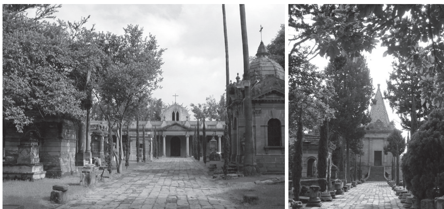
Área central, capilla, tumbas y mausoleos (fotografías: Beatriz Núñez, septiembre de 2003).

Señora de la Salud (García, 2007: 99-101). “Los cementerios del siglo XIX, son los panteones de los dioses devenidos en hombres por la modernidad” (García de Alba-García et al. , 2001: 309). Asimismo, a la par de las innovaciones estilísticas se incorporó el término panteón, en uso desde el siglo XVIII para referirse a los monumentos funerarios destinados al enterramiento de personas (Alonso, 1991).