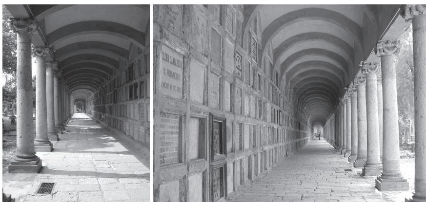
Galerías techadas del panteón de Belén (fotografías: Beatriz Núñez, septiembre de 2003).